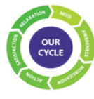
CICLO DE CONCIENCIA